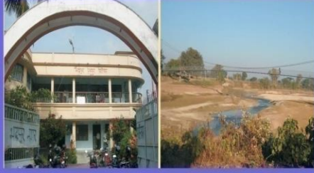
मद्रपुर नगरपालिका कार्यलय भगेलुङ्गे पुल चन्द्रगढ, मद्रपुर-१०