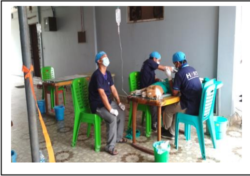
सामुदायिक कुकुरहरुको बन्ध्याकरण