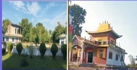
कमलधाप धार्मिक तथा पर्यटकिय स्थल, मद्रपुर - ३