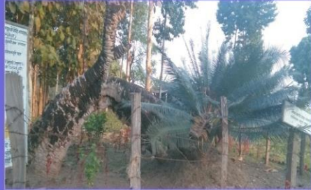
पर्यटकिय स्थल कलवलगुरी (कलवल वृक्ष), मद्रपुर - १०