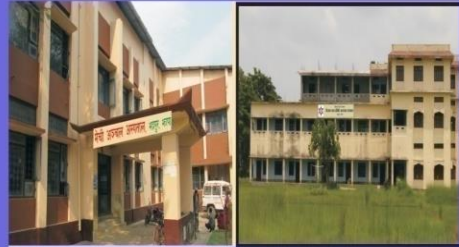
मेची अञ्चल अस्पताल, मद्रपुर-८ मेची बहुमुखी क्याम्पस मद्रपुर-८