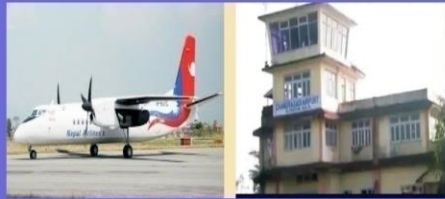
चन्द्रगढी विमान स्थल, मद्रपुर - ८