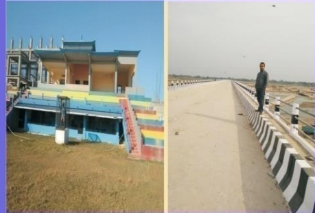
मेची रंगशाला, मद्रपुर-६