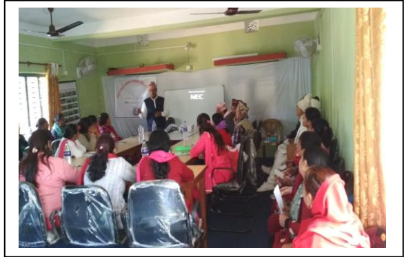
पशु विमा तथा पशु पालन व्यवस्थापन तालिम